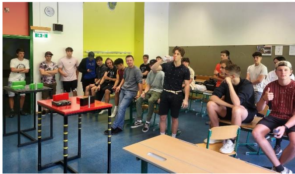
Armrestling am Schulsporttag 2023

Die Schulleitung unterstützte dieses Vorhaben und stellte einen geeigneten Trainingsraum im Schulgebäude zur Verfügung. Damit begann die Entwicklung von einer beliebten Sporttag-Tradition hin zu einer dauerhaften Armwrestling-Gemeinschaft an der HTL Jenbach.